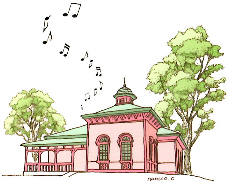
国登録有形文化財(建造物)