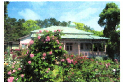
太陽の光を浴びて 八幡 洋子

お問合せ 八幡山の洋館(旧横浜ゴム平塚製造所記念館) 電話 0463-35-7114 メールアドレス hachimanyamanoyokan@ma.scn-net.ne.jp